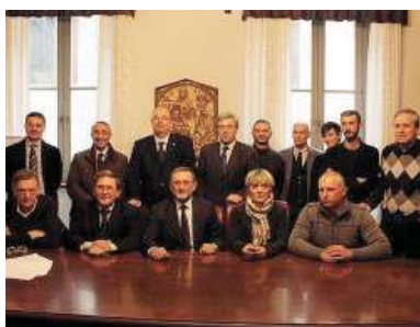
Soci fondatori e direttivo del distretto del commercio di Treviglio

Questo è il nostro modo concreto per essere vicini al mondo dell'associazionismo e del volontariato. E il modo per farlo scoprire a tutti i nostri lettori.